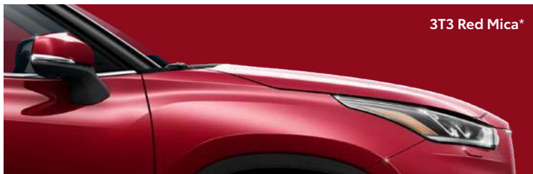
3T3 Red Mica*