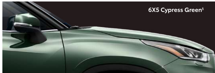
6X5 Cypress Green s