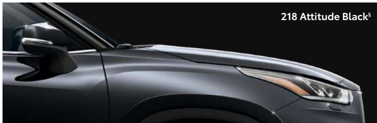
218 Attitude Black s