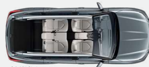
5 posti 865* litri