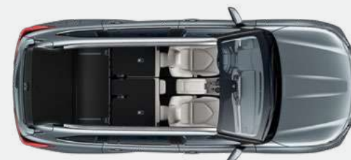
2 posti 1.909* litri