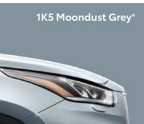
1K5 Moondust Grey*