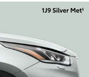
1J9 Silver Met s