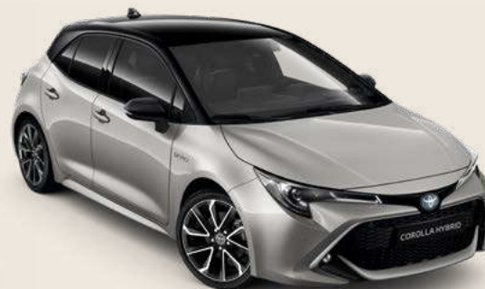
2RD Precious Silver § & Black §