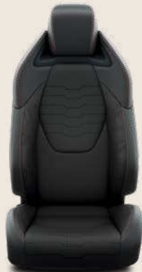
Pelle parziale nera, cuciture rosse e finiture nere. Di serie su allestimento Lounge.