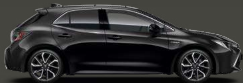
209 Black Met §