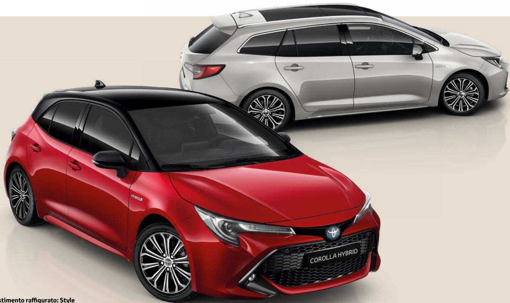
Allestimento raffigurato: Style