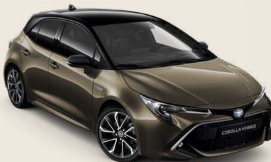
2RF Oxide Bronze Met § & Black §