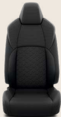
Tessuto nero/grigio, cuciture grigie. Di serie su allestimento Active e Style.