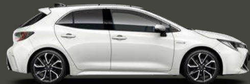
040 Super White