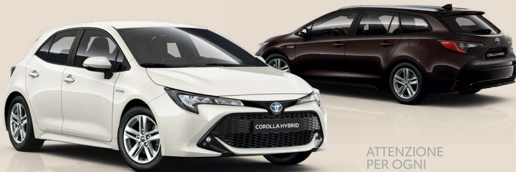
Allestimento raffigurato: Active

ATTENZIONE PER OGNI DETTAGLIO, ANCHE IL PIÙ PICCOLO.