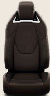
Pelle traforata nera e finiture satin cromate. A richiesta su allestimento Lounge.