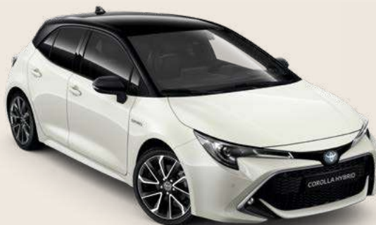
2KR Pearl White* & Black §