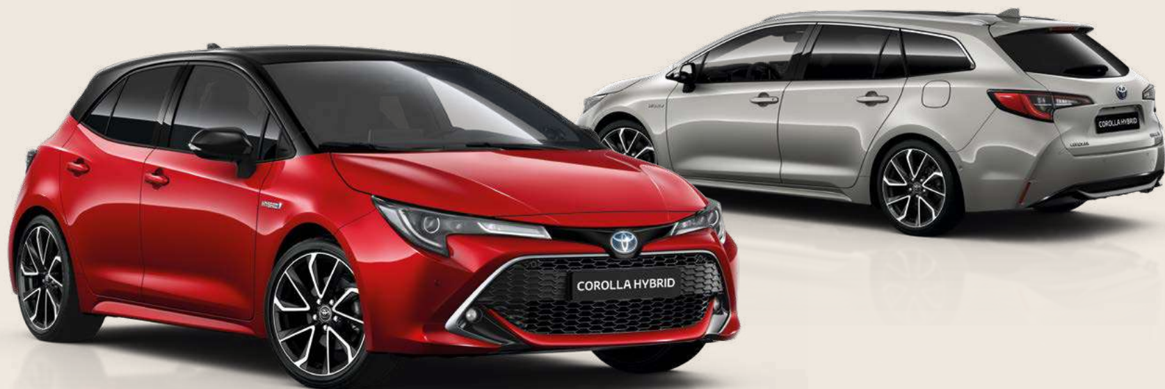
Allestimento raffigurato: Lounge