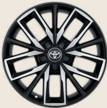
Cerchio in lega da 17" Nero Lavorato pneumatici invernali Yokohama BluEarth Winter misura 225/45 R17