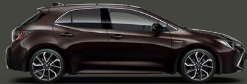
4W9 Phantom Brown Met 5