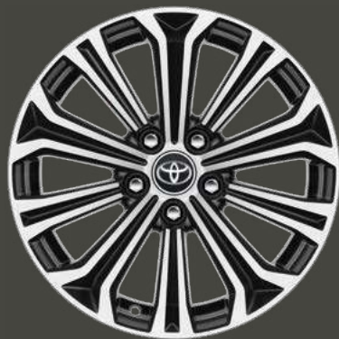
Cerchi in lega da 17" con inserti Black di serie su allestimento Style