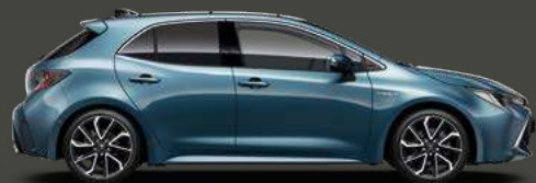
8U6 Frozen Blue Met 5