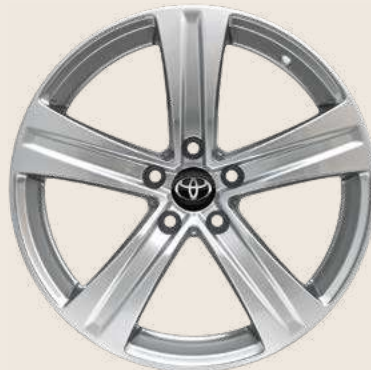
Cerchio in lega da 16" Silver pneumatici invernali Yokohama BluEarth Winter misura 205/55 R16