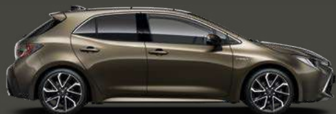
6X1 Oxide Bronze Met §