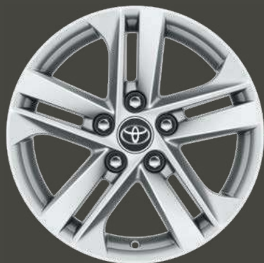
Cerchi in lega da 16" di serie su allestimento Active