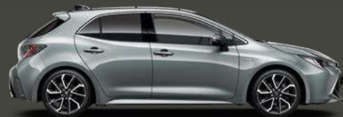
1H5 London Grey Met 5