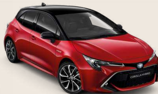
2SZ Emotional Red § & Black §