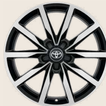
Cerchio in lega da 18" Nero Lucido Lavorato pneumatici invernali Yokohama BluEarth Winter misura 225/40 R18