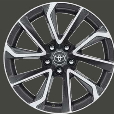
Cerchi in lega da 18" con inserti Black di serie su allestimento Lounge