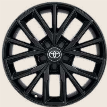
Cerchio in lega da 17" Nero pneumatici invernali Yokohama BluEarth Winter misura 225/45 R17