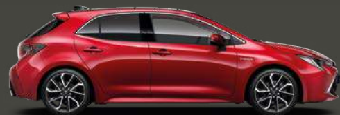
3U5 Emotional Red 5