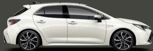
070 Pearl White*