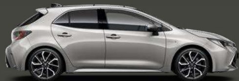
1J6 Precious Silver 5