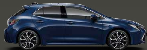
8Q4 Dark Blue