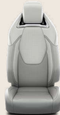
Pelle traforata grigio chiaro e finiture satin cromate. A richiesta su allestimento Lounge.