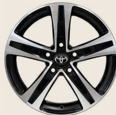
Cerchio in lega da 16" Nero Lavorato pneumatici invernali Yokohama BluEarth Winter misura 205/55 R16