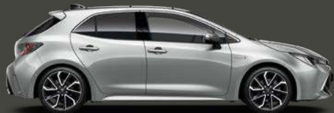
1F7 Silver Met §